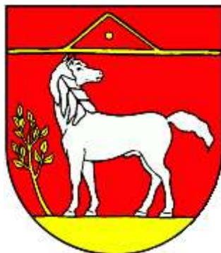
Erb obce Kónská